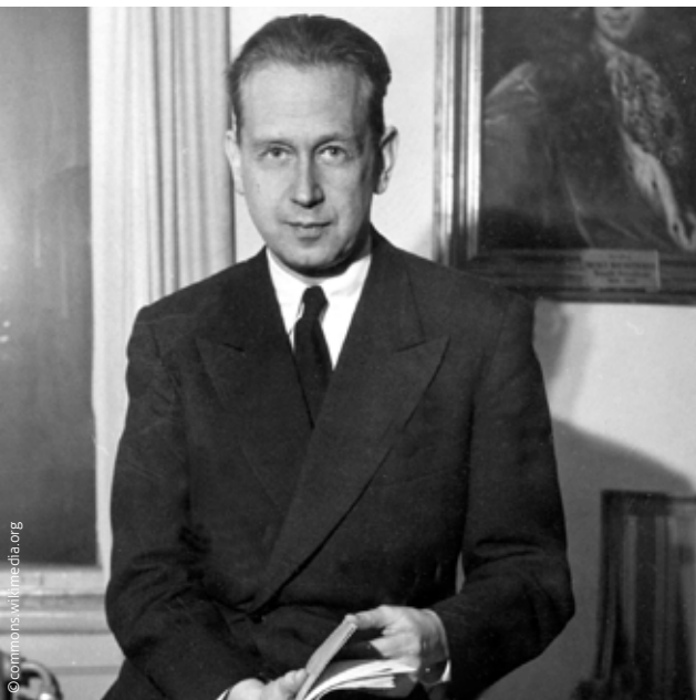
Dag Hammarskjöld, 1953 zum 2. UNO-Generalsekretär ernannt.

Dag wuchs in einer wohlhabenden und einflussreichen schwedischen Familie auf. Hjalmar Hammarskjöld, sein Vater, war ein herausragender, aber auch furchteinflössender Beamter. Besonders als Premierminister von Schweden war er mehrheitlich abwesend. Wärme erfuhr Dag von seiner Mutter Agnes, die ihren Kindern auch den christlichen Glauben vorlebte. Erst nach der Veröffentlichung von Dags geistlichem Tagebuch «Gedanken am Weg» wurde klar, wie sehr ihn der christliche Glaube geprägt und getragen hatte. Vom Vater übernahm Dag die Laufbahn. So arbeitete er nach seinem Studium der Volkswirtschaft und Philosophie auch als Beamter,