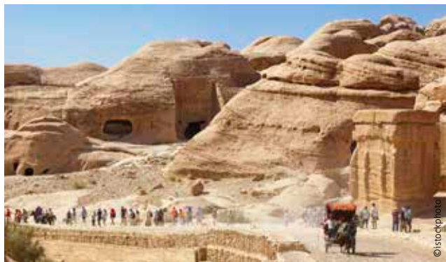
Die jordanische Wüste war Ort einer bewegenden Geschichte der Versöhnung.

Dies ist nur der erste Schritt und dennoch sind wir bereits weit gekommen. Der Tenor der Begeg-