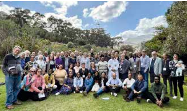
Die Pilgergruppe bestand aus Leitenden verschiedener Werke und Denominationen Südafrikas sowie einigen Gästen aus dem Ausland.