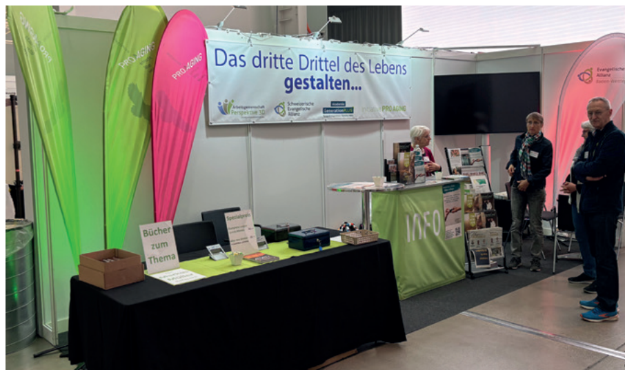
Am gemeinsamen Messestand der lokalen Allianz und der AG Perspektive 3D entstanden viele gute Gespräche über das Älterwerden.

«Ich sah, wie die Freiwilligen mit Begeisterung dabei waren – das war